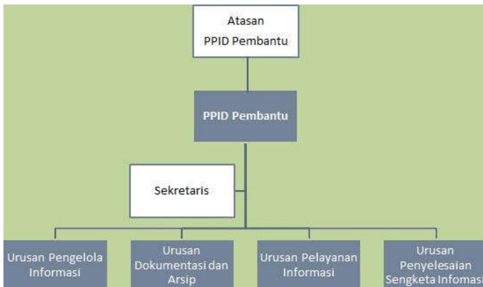
Gambar 1. Struktur Organisasi PPID Pembantu Dinas Pekerjaan Umum, Perumahan dan Energi Sumber Daya Mineral DIY (SK Ka. Dinas PUPESDM DIY Nomor 188/07492/KEP/2021)

Dinas PUPESDM DIY secara aktif melakukan penyebarluasan informasi publik kepada masyarakat dan melakukan berbagai upaya untuk mengoptimalkan layanan informasi publik kepada masyarakat. Kegiatan yang dilaksanakan antara lain: