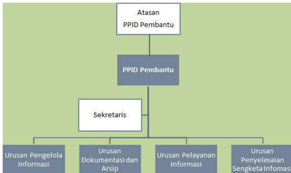
Gambar 1. Struktur Organisasi PPID Pembantu Dinas Pekerjaan Umum, Perumahan dan Energi Sumber Daya Mineral DIY (SK Ka. Dinas PUPESDM DIY Nomor 188/07492/KEP/2021)

Dinas PUPESDM DIY secara aktif melakukan penyebarluasan informasi publik kepada masyarakat dan melakukan berbagai upaya untuk mengoptimalkan layanan informasi publik kepada masyarakat. Kegiatan yang dilaksanakan antara lain: